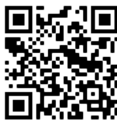
Nummer gg. Kummer